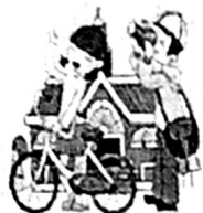
สายท่องเที่ยวเชิง วัฒนธรรม