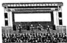
สายงานเทศกาล คอนเสิร์ต วิ่งมาราธอน