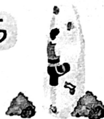
สายแอดเวนเจอร์