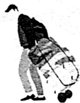
สายลุยเดี่ยว