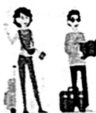
สายบุญสายมู