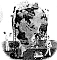
สายรักธรรมชาติ