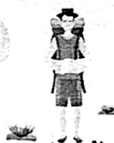
สายเที่ยวสั้น