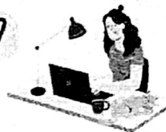
สายฟรีแลนซ์