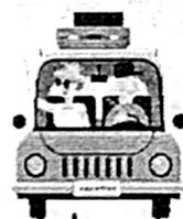
สายเที่ยวยาว