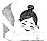
สายสุขภาพ และเวลเนส