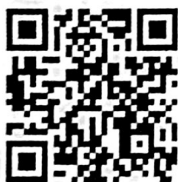
(นายเสกสรร สวัสดิ์ศรี) นายอำเภอเกษตรสมบูรณ์

ที่ทำการปกครองอำเภอ สำนักงานอำเภอ โทร. ๐ ๔๔๘๖ ๘๑๑๕