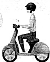
สายเที่ยววันเดียว