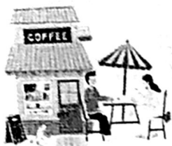
สายคาเฟ่